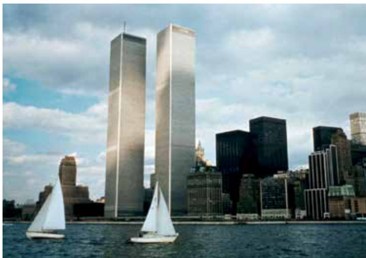
Fig. 4. Las Torres Gemelas desde el río Hudson en la década de los setenta.

Conclusiones. Cuando no se pretende dar a la forma una entidad propia, cuando ésta se limita a ser el resultado de la función de una estructura, es entonces esa función la que toma la palabra. Parte de la crítica de Lewis Mumford hacia las Torres fue que no eran “más que archivadores de vidrio y metal”. (18) La situación es inversa a aquellos edificios en los que existe, por ejemplo, una referencia historicista. No consta que Yamasaki quisiera darle a las Torres la apariencia de archivadores gigantescos y, sin embargo, eso era exactamente lo que eran: clasificadores de factores