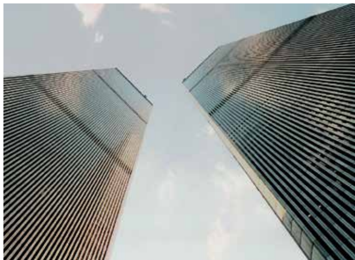
Fig. 2. Perspectiva de las Torres Gemelas desde su plaza central.

La síntesis. Escribe Rem Koolhaas: “Los hombres de negocios tienen que admitirlo: el manhattanismo es el único programa en el que la eficacia se cruza con lo sublime”. (10) Más importante que la caracterización de los niveles es la de los lazos que los articulan; esas relaciones entre planos que los transforman en síntesis de una dialéctica, en lugar de mantenerlos como categorías independientes. Tampoco en este caso se trata de un concepto unívoco, sino que los puentes entre ambos niveles se establecen de forma múltiple. La relación de esta realidad poliédrica se hará bajo una dinámica inductiva, caminando desde los particulares al factor común conformado por ellos. Cabe mencionar, en primer lugar, la lógica aritmética, que participa tanto en los cálculos necesarios para levantar los edificios como en las herramientas básicas de las actividades empresariales llevadas a cabo en su seno. Ese recurso compartido a lo matemático es especialmente significativo: en primer lugar, el propio lenguaje matemático engloba tanto el