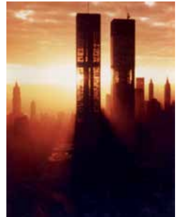
Fig. 3. Las Torres Gemelas durante su construcción.

En el caso del escrito de Sullivan, dicha cohesión se puede rastrear a través de las referencias a la naturaleza y la consiguiente búsqueda de la verdad a través de lo universal, lo que a través del trascendentalismo de Whitman, Thoreau o Emerson conduce al idealismo trascendental kantiano. De tal manera, los escritos de Sullivan tienen una entidad filosófica propia más allá de la práctica arquitectónica, que no solo prefiguró el funcionalismo del siglo xx sino que estaba por delante de los propios proyectos del arquitecto de la Escuela de Chicago, aún inmerso cronológica y formalmente en la retórica de la ornamentación, que también seguía vigente al otro lado del Atlántico. Por su parte, el vínculo entre Sullivan y el poeta que mejor prefiguró la identidad estadounidense del siglo de las Torres, Walt Whitman, (13) no es hipotético ni meramente conceptual. En un artículo de la revista Walt Whitman Quarterly Review , Kevin Murphy escribe: “En una carta adulteraria escrita a Whitman poco antes de haber recibido la aprobación final a su propuesta para el Auditorium Building, (14) el joven Sullivan confesó al anciano poeta que su órbita ‘respondía al nuevo sol atractor’ y buscaba el consejo y la opinión de Whitman”. (15)