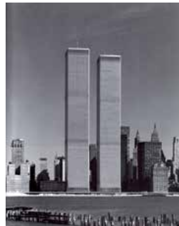
Fig. 1. Las Torres Gemelas en toda su plenitud ortogonal.

Es necesario justificar que las Torres Gemelas constituyan la representación material de esa articulación. En efecto, las Torres funcionan a dos niveles, a los que desde una perspectiva arquitectónica cabe denominar ‘forma’ y ‘función’, pero que de hecho, están conformados por múltiples nociones que no solo se adscriben al campo arquitectónico. La ‘forma’ de las Torres, su simplificación abstracta, se relaciona por su inherente idealización con la razón en un sentido cartesiano: los dos monolitos prismáticos, no solo recurren a lo euclídeo en su reducción ortogonal, sino que la doble referencia a lo paralelo (paralelismo entre los pilares exteriores, por una parte y paralelismo entre las dos Torres, por otra) remite necesariamente a la noción de infinito y con ella a lo ideal, dado que dicho infinito solo puede ser aprehendido por la razón, por el sujeto pensante. Las connotaciones de ese nivel ideal son la